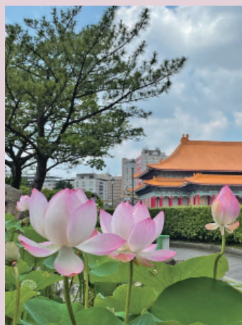
人行道邊即見鮮豔的蓮花←

行政院新聞局出版事業登記證局版台誌字第〇三九一號 中華郵政北台字第〇六〇二二號 執照登記為雜誌類交寄