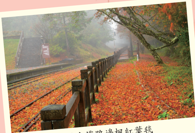
阿里山鐵路邊楓紅葉毯