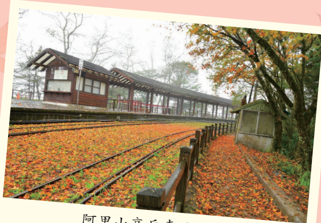
阿里山高岳車站月台