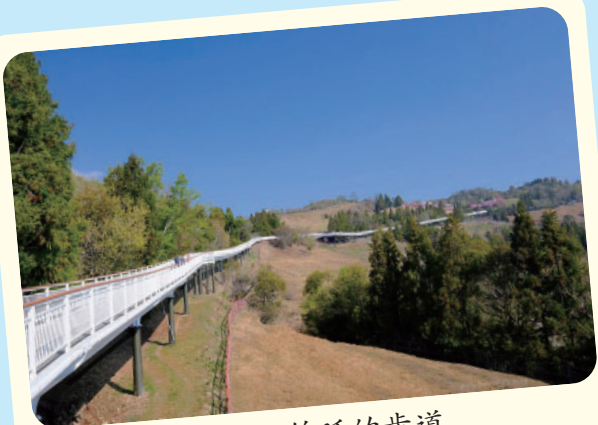
巨龍般綿延的步道