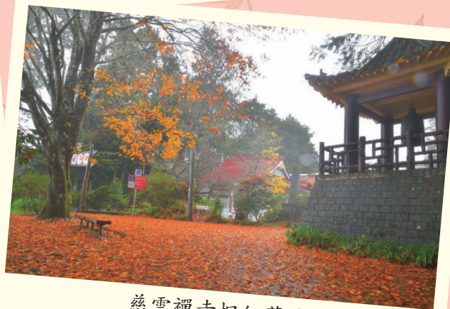
慈雲禪寺楓紅葉毯