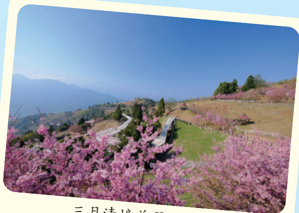
三月清境美麗的櫻花