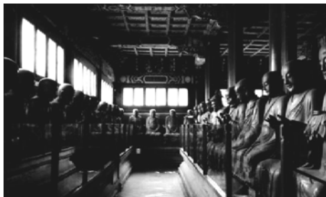
紹興開元寺曾經有類似的羅漢堂

一般來說，寺院供奉羅漢為十八尊或五百尊。十八羅漢通常設於大雄寶殿內的兩旁，五百羅漢則建羅漢堂專門供奉。開元寺羅漢堂位於大雄寶殿右後方。偌大殿堂分隔成曲折回復的條條長廊，五百羅漢，分別在廊的左右兩側的佛座上，形神兼具，頗為壯觀。這五百羅漢像高一米以上，千姿百態，栩栩如生，可謂蔚泥篋藝術之大觀。據傳，這藝術瑰寶係蘇州能工巧匠倪蔚起精心之作，費時三年。