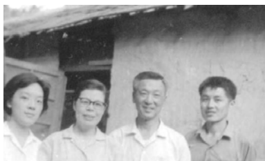
在大豐農場，左起佳美、姨媽、姨夫、作者（文革時）