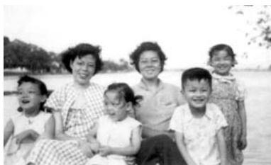
圖中右二是最頑皮、最不用功讀書的作者（1956）