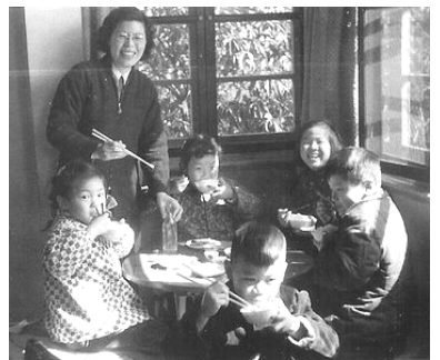
在大姨媽家，右一為作者，立者為大姨媽（50年代）

到國外定居，從小到大，母親就把姨媽家作為娘家，逢年過節，就帶著我往姨媽家跑，彷彿能找到昔日父母的溫情。