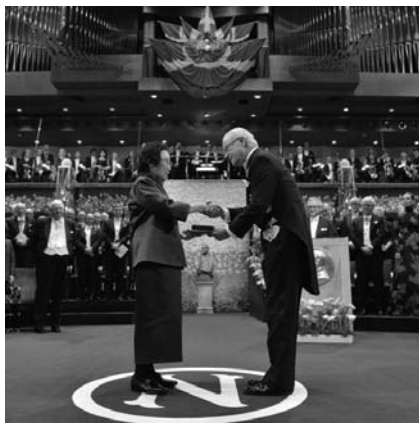
屠呦呦接受瑞典國王頒獎

的還有愛爾蘭醫學研究者威廉·坎貝爾、日本科學家大村智等三人。在中國本土進行科研，首次得諾貝爾獎的屠呦呦是中國醫學界所獲最高的獎項。