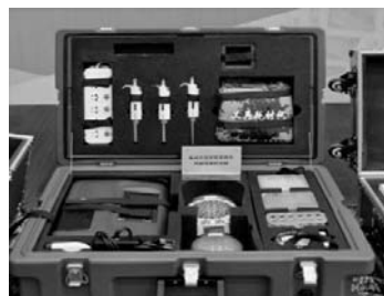
大陸自製的「核酸快速檢驗箱」及其附屬試劑

得檢測結果，因此讓等待檢測的病患及家人寬心不少。也因為病患經過核酸快速篩檢之後，反而使確診人數為之暴增，難免引發心理的恐慌，但卻有助於整個疫情的分辨與防治。