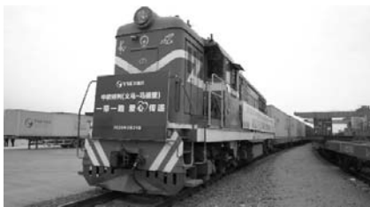
為X-8020中歐班列 正由義烏西站出發

歐物流有限公司」聯合無償捐贈給西班牙的醫療物資，並且全額免費贈送西班牙。如此的舉措，不僅展現出人溺己溺的情懷，也透析出深厚的人文底蘊；更重要的，大陸在倡議「一帶一路」的同時，更加彰顯出「一帶一路」是文化的、旅遊的、物流的與人情感聯繫的渠道，絕不是西方國家以其私心自用的想法可以侮蔑的。