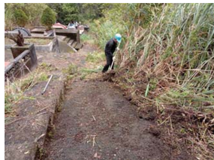
墓園風水絕佳、土壤肥沃，雜草茂密，務必定期除草