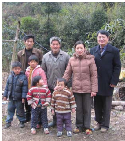
作者與馬劍鄉親一家

摘有嚴格標準，特色是外形挺直圓紫，略扁形似一柄短劍，葉邊茸毛依稀，色澤銀翠，形態優美。鄉民對炒製方法與眾不同，有嚴格規矩，即所謂「三烘四炒」，此種精細加工工藝，採用機械與手工相結合的方法炒製，品質優於別處。