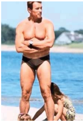
69歲時的 阿諾·施瓦辛格

從這六點影響可知，肌肉量減少對人的影響很大，緊急應變能力變差、行動力喪失，會造成容易跌倒或骨折，最主要的是影響生活的獨立性，以及身體外觀。只要看美國前加州州長阿諾·施瓦辛格身材的變化就知道了，他曾是魔鬼終結者，曾是世界健美比賽冠軍喔！但隨著時間流逝老了，他也變樣啦！大家都看得出來時間是很無情的，相信他當加州州長時還是有努力鍛鍊身體，但時間終究是無情的，所以個人外表還是會受到影響。