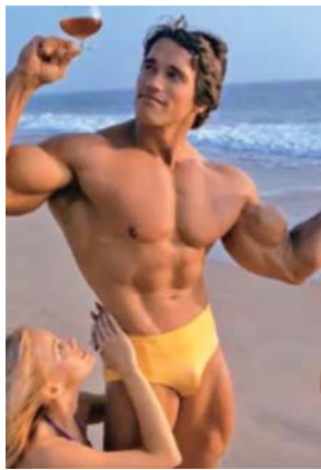
23歲時的 阿諾·施瓦辛格