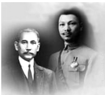
姚觀順將軍與國父孫中山先生