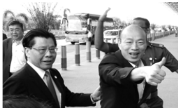
2月28日梁大使歡送 韓國瑜市長

，無不粉絲廣佈，引起人群騷動爭相 親近。總結韓市長賢伉儷接地氣平易 近人，為人親和、親民、誠懇毫無架 勢。當選之後說到做到，日夜全力投 入政務，一心為人民服務。行事果斷 機智有魄力，敢作敢為更令對手折服 ，難怪台北市王世堅議員稱頌他是百 年必有之明主。未來總統的理想候選 人。