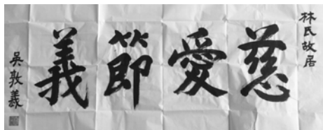
民國一〇八年五月十三日中國國民黨吳敦義主席面交親筆手書之「林氏故居、慈愛節義」墨寶