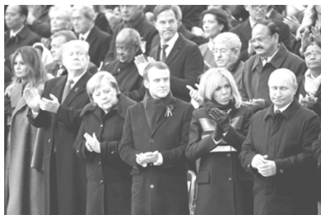
美國總統川普夫婦(前排左起)、德國總理梅克爾、法國總統馬克宏夫婦和俄國總統普亭

歐戰結束一百週年，隆重的儀式，在寒風細雨的法國巴黎中心的凱旋門下舉行，其時筆者適去浙江外島交流訪問，無法看到當時傳媒報導的盛況，歸來後，祇在平面媒體上見到所載的報導。十一月十一日那天，巴黎亦是風寒不已，作為地主國領袖的法國馬克宏總統，發表嚴正的演說，