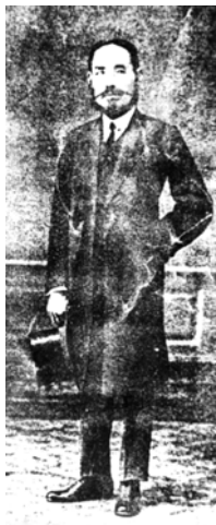
韓國革命志士申圭植（一八七九

年一月十三日～一九二二年九月），又名裡，號晚觀，又號一民、餘膏、青邱恨人，韓國忠清北道清原人。申氏自幼喜習漢學，一八八九年入官立漢語學校，畢業後考進陸軍武官學校。一九〇七年，日本妄圖併吞韓國的野心畢露，他們其中一項舉措是逼迫