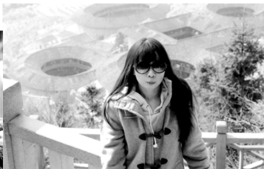
107 年 10 月攝於廈門