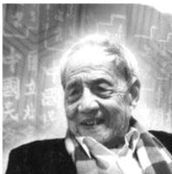
妻子匡先生晚年留影

可以說，妻子匡將他的一生獻給了祖國的民俗學、民間文藝事業，在中國俗文學史上豎起一座令後人仰望的豐碑。