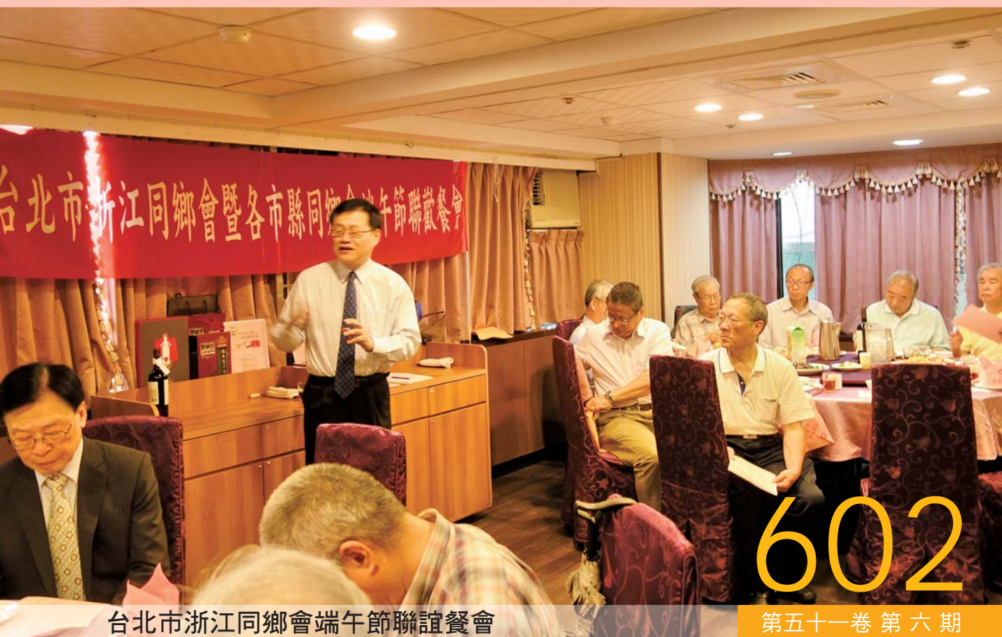
台北市浙江同鄉會端午節聯誼餐會