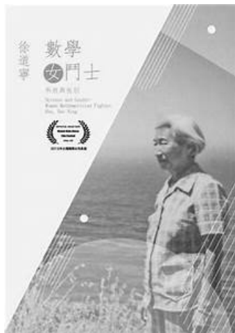
紀錄片「科技與性別——數學女鬥士徐道寧」之封面

給台灣數學教育的故事。影片藉著自述與訪談，勾勒她的生平與成長歷程，側面觀察了她作為一位女性的女性特質、資質、性格與抱負，投注她畢生智慧與精力於台灣科技與人格教育，並發揮其強大的影響力，值得讀者併同觀賞。