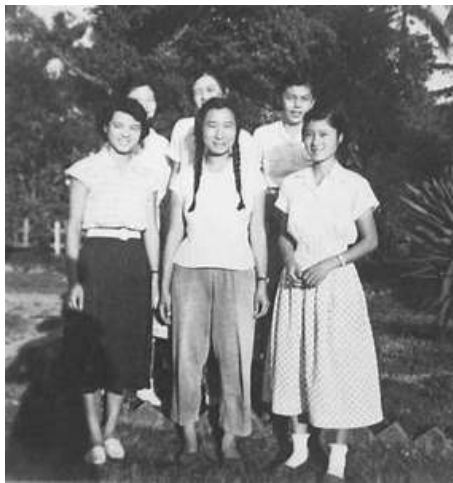
徐道寧教授年輕時與學生合影

※作者一生奉獻數學教育，由於從小接受教育的過程中，感受到不論是男老師或女老師，對男女學生的學業要求存有差別，認為女孩子終究要嫁人，在家相夫教子，因此不用對女學生太嚴格。她對此並不認同，故在後來從事教育的路上，徐教授特別重視女子教育，不會因為性別的不同，而給予不同的標準。紀錄片「科技與性別——數學女鬥士徐道寧」是關於徐道寧教授作為台灣第一位女數學博士，和她一生奉獻