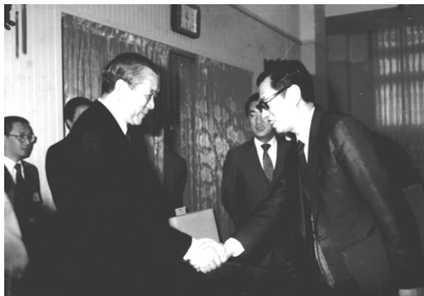
行政院長孫運璿接受作者訪談