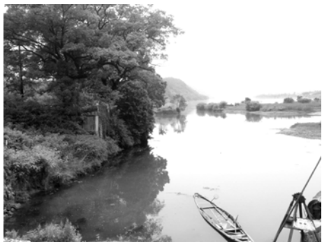
下涯的出水口，注入新安江 (2013)