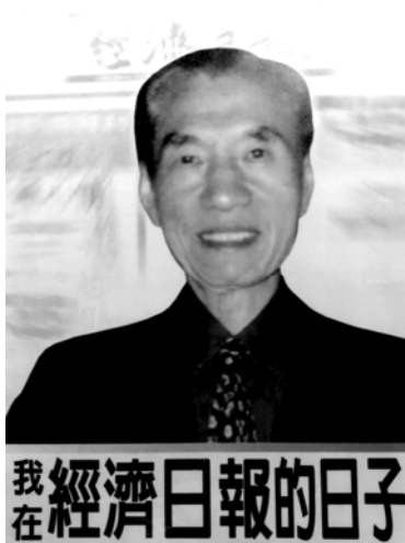
作者出版一本《我在經濟日報的日子》的另一封面設計（與原書封面不同）