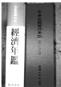
民國66年第一本經濟年鑑，與民國105年慶書背