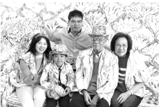
遊百貨公司變裝秀