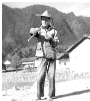
差美了個得者 （70年代）

如果是陰雨天，還需將新鮮稻穀攤在走廊上晾乾，怕堆在庫中的稻穀黴變。生產隊對知青特別關心了，讓我做這個美差。