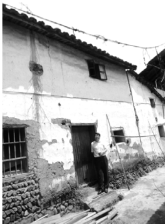
作者返回金村知青屋前 (2014)