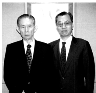
舉辦企業家演講會，作者與第一次召開演講的台塑董事長王永慶合影