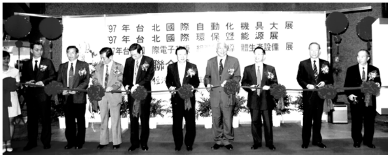
舉辦國際性產品展，邀請《聯合報》相關企業領袖剪綵（前排左一為作者）