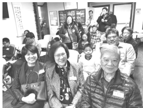
參加聖誕節教會活動

最後我要感謝加州的親朋好友熱情的款待，吃遍了各種美食，遊了名勝古蹟，同時更要感謝主保護了我的身體健康，平安的回到台北溫暖的家。