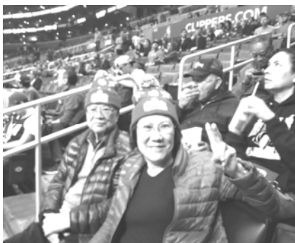
觀賞 NBA 籃球比賽