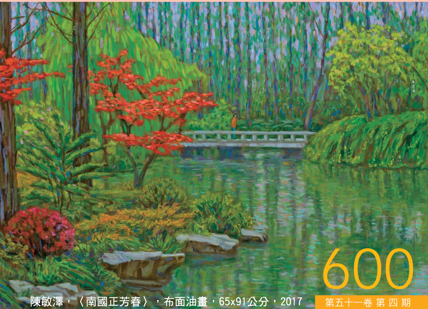
陳敏澤，〈南國正芳春〉，布面油畫，65x91公分，2017