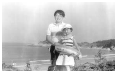
我的第一濱海之旅 我與爸爸在海邊（1992）

上世紀八十年代，杭州只有二家旅行社，即中旅（中國旅行社）與國旅（中國國際旅行社），上級對這二家旅行社業務範圍作了明確分工，「中旅」只限於負責對日本、港澳及華僑的旅遊活動；「國旅」則負責歐美來賓的旅遊接待。