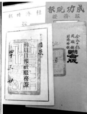
作者最早的服务證