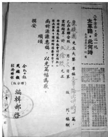
民國 42 年聯合版的稿費單