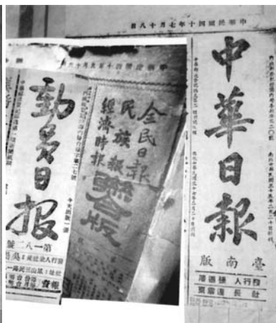
民國 40 年作者最早任特約通訊員時的三種報紙報頭