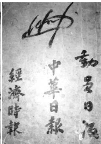
作者最早的見報稿子剪貼本封面