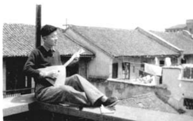
作者在未央郵的陽台上 (70年代)