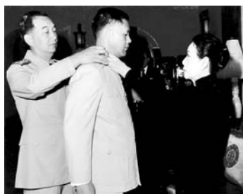
代贈蔣夫人蔣公逝世後，蔣官林以鄒堅蔣表政府於士，蔣公表雲之