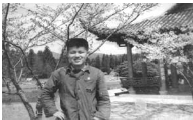
作者 60 年代在植物園

書可以外借回家，孤山分館的書只能在館中閱讀。習慣上杭州人將西湖分為外西湖與裡西湖，外西湖多指白堤以外的湖面，裡西湖為白堤靠北山路的湖泊，圖書館正好座落在孤山陽面。母親借了書，找把椅子，坐在館外草地樹蔭下，靜靜地讀書。