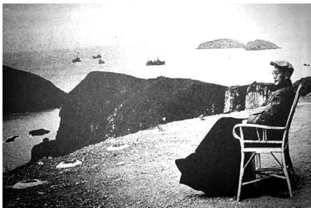
蔣公在大陳島遠眺大陸態度 安祥狀似沉思為極其難得的一 幅照片