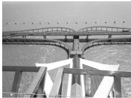
杭州灣跨海大橋海中平台的匝道

灣跨海大橋於建設中採用多項先進技術，很值得土木科系或造橋工程業者參觀考察。大橋的設計結合景觀，借鏡了杭州西湖蘇堤的「長橋臥波」美學理念，橋面為S形，藉以消除駕駛者的疲勞心理。離南岸約十八公里處，設有一個面積達一·二萬平方公里的交通服務救援暨旅遊休閒觀光功能的杭州灣跨海大橋海中平台，也是我們中途下車休息遊覽之處。