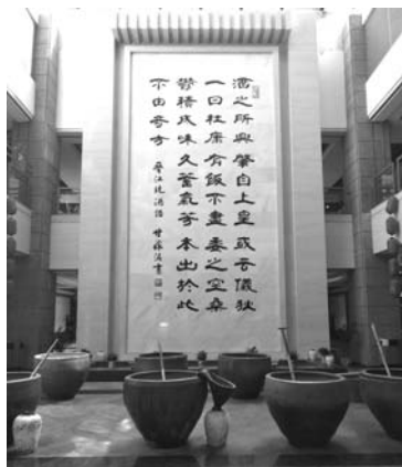
紹興黃酒城展示一角

一個主要參觀點，占地四百餘平方公尺，以傳統模式存放著陳年黃酒，還可品一小杯酒，不論是酒釀或是紹興黃酒，都是那麼的冰涼、甘甜、爽口，讓營員難以控制，紛紛「慷慨解囊」買幾瓶紹興酒帶回台灣。