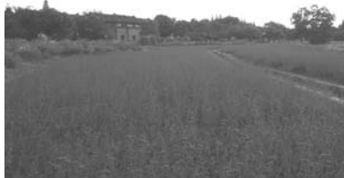
烏鎮的廣闊紫色系花園 傍晚即景

造，成為一個海中觀景平台，總建築面積為四一、七〇〇平方公尺，由觀光平台和觀光塔兩部分組成。到達景區後，我們先在停車場下車，然後由導覽人員介紹說明，並乘著海風，四處遠眺並拍照，在自由活動中，可以領略杭州灣的廣闊、大橋的壯麗、海水的洶湧、海風的威力，並可看到昨晚住宿的世紀金源大酒店。拍完照後接著搭車前往烏鎮，下午三點車隊抵達位在嘉興市桐鄉的烏鎮黃金水岸酒店。經稍事休息後，下午五點半前往附近的西柵景區，並在昭明餐廳晚餐。晚餐後，開始了今晚的夜遊。