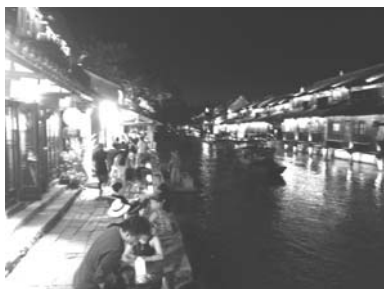
烏鎮真是 小橋、流水、人家