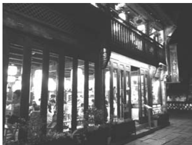
在烏鎮總有明清時代 穿越感

時代的蛻變，烏鎮依然完整保存著水鄉古鎮的風貌及特色，漫步其間彷彿穿越到了明清時代。別具特色的臨水建築，透露出樸實、悠閒、文史的韻味，所以烏鎮被稱為「中國最後的枕水人家」，是江南水鄉「小橋、流水、人家」的典範，是浙江北部著名景點，在二〇〇一年時還列入「世界文化遺產」，這樣的地方真的值得放鬆心情住下，並多來幾趟。夜遊是在下午六點多開始，這時仍是傍晚，夕陽西下，晚風襲來，營員成群倘佯在廣闊的紫色系花園裡，感受到周邊景致的優雅美麗，心情格外舒暢，忍不住紛紛拿起相機自拍、互拍，歡笑爬上每個人的臉上。不久，夜幕低垂，在燈光搭配下，烏鎮真的是越夜越美麗