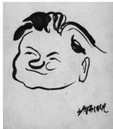
父親作淺予畫(40年代) 葉漫

說，可以『上網連線』的言論，生搬硬造的，這是人家支唔亂造的事。」又說：「我心裡有數，人家劃我右派，平生只有三大錯，一是有個資產階級丈人；二在湖邊造了幢房子；三是看不起領導（不巴結上司），領導不舒服，再說受過舊教育，人家會放過嗎？」