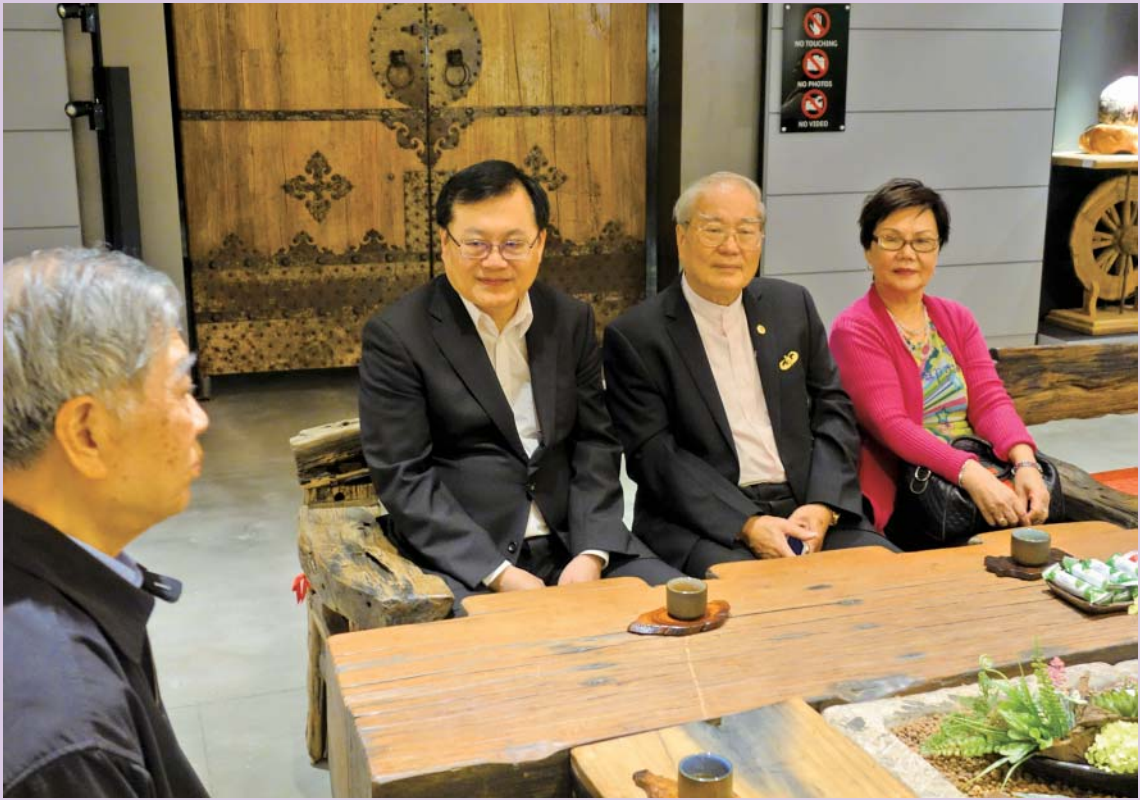
本會理事長、副理事長及理監事一同參訪