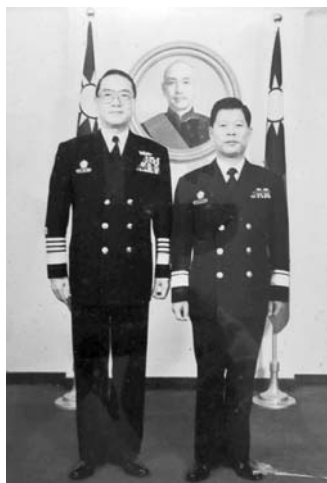
季平將軍與故海軍總司令顧崇廉合影

平易近人得人緣，至親好友常往訪。將令必行治軍嚴，護國愛民獻至誠。軍紀嚴明領頭行，精誠團結一條心。青山綠水青田城，尋根之旅訪親人。田魚稻米共生存，四季豐收農家樂。俊男美女世界情，五湖四海事業成。傑出將領是季平，豐功偉業令人敬。