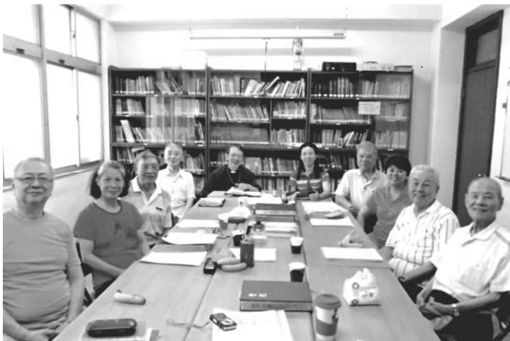
教會讀經班教友合影→

一生忠誠服公職，任勞任怨有分寸。讀書為樂勤創作，作品豐富有器度。同鄉聯誼勤出席，服務周到個性好。生活規律重健康，晨運活動天天行。意外事件辭世去，無病無痛好福份。