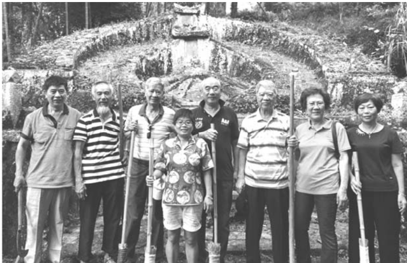
夏理事長夫婦與大陸親人至父母墳前掃墓