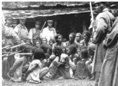
莫那·魯道與霧社事件

、次於該地海邊岩石親書「勤」字以資紀念。我們深深希望台灣寶島再出現一位現代戚繼光，掃清倭寇。 轉載自河北北京津文獻第四十三期，作者為劉津靜。