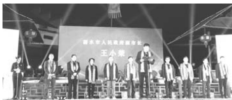
啟動儀式上，麗水市人民政府副市長王小榮致辭