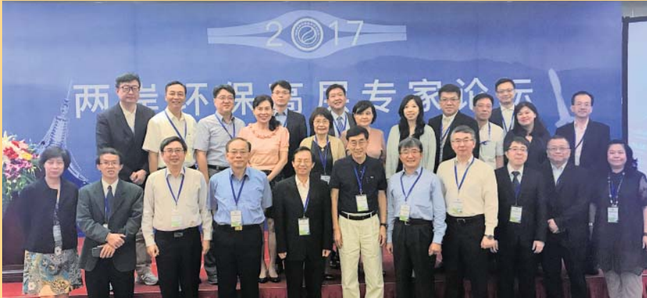
台灣前環保署長沈世宏先生擔任團長與團員合影