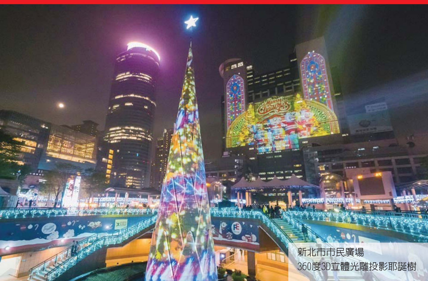
新北市市民廣場 360度3D立體光雕投影耶誕樹