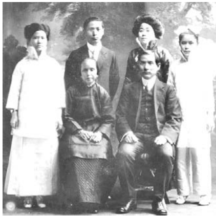
中山先生早年與盧慕貞夫人暨子女合影

彰顯德業的一位後裔。四女穗芬為二夫人藍妮所出，曾在台灣擔任任空中小姐，約在民國七十五年前後，隨其母藍妮應中共當局的邀請赴大陸訪問，母女都深受早年相識友人鄧穎超（周恩來夫人）等人士接待，穗芬一度曾擔任美國駐上海總領事館的商務領事，作為促進中美兩國商務貿易的橋樑，溝通增進兩者間的發展與增長，嗣後辭職奔波太平洋兩岸三地，投入商務活動，不幸於二〇〇一年元旦，在訪問台灣，離去時發生車禍，不治身亡；至其母藍妮女士，當我早年在南京時，久聞其大名，應是受到有心人士的惡意攻訐污蔑與破壞，負面訊息