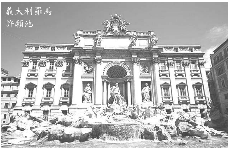
義大利羅馬 許願池

世明主持，他熱烈歡迎來自全球各國參與會議的僑胞，並報告我與梵蒂岡外交關係保持良好。未料近日報載，外傳大陸與梵蒂岡將簽「建交前期協議」，真令人驚訝！梵蒂岡如真跟大陸建交，那肯定是要跟我方斷交，雖然梵蒂岡土地不大，但對中南美邦交國影響最大，因多以信奉天主教為主，我政府應加速推動有效政策，尋求擴大合作，以穩固我歐洲唯一的邦交國。