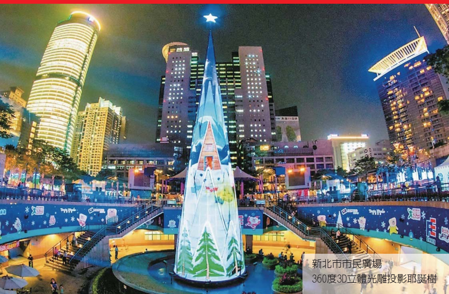
新北市市民廣場 360度3D立體光雕投影耶誕樹