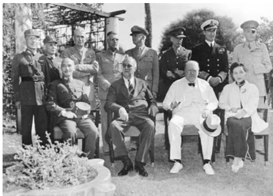
中、美、英三國領袖在開羅舉行會議