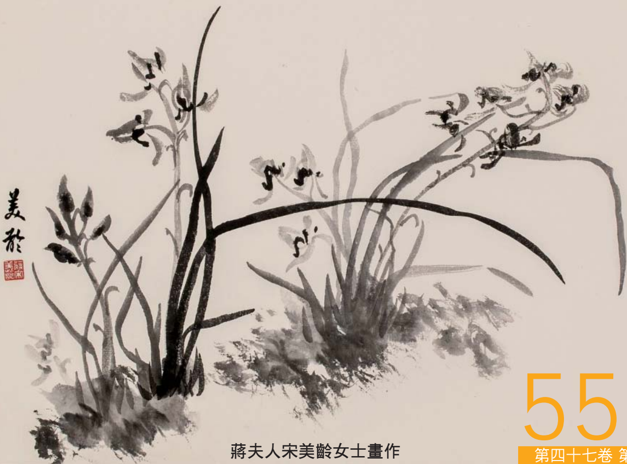
蔣夫人宋美齡女士畫作