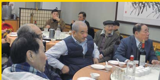
▲ 浙江各府縣總幹事新春聯誼餐會 ▲