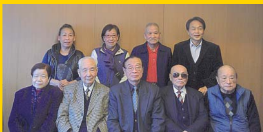
▼ 餘杭春酒 ▼