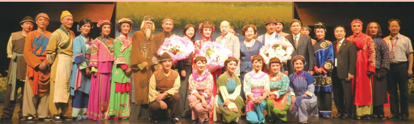
浙江越劇團〈九斤姑娘〉來台公演