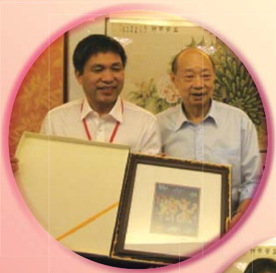
本會葉理事長與 金興盛廳長交換禮物