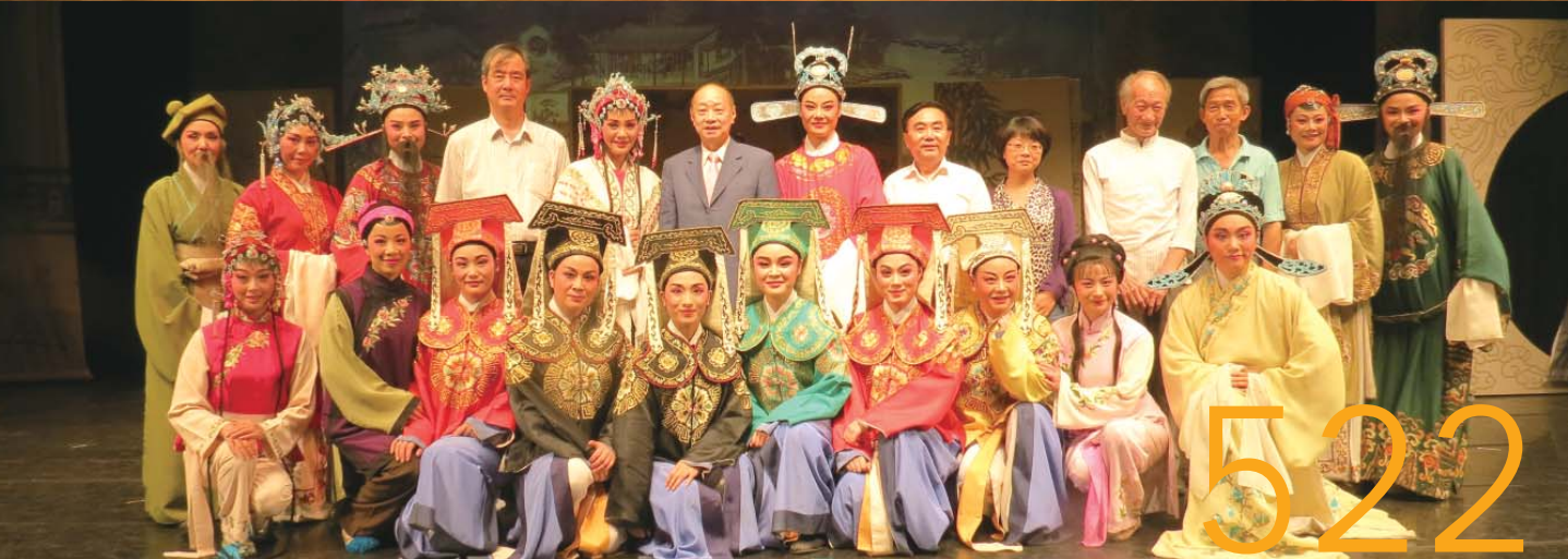
嵊州市越劇團〈碧玉簪〉來台公演