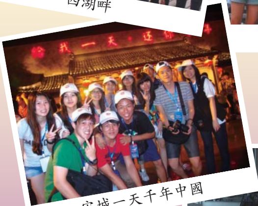
宋城一天千年中國