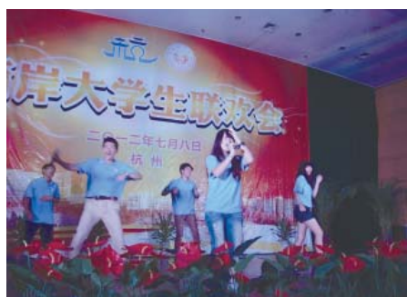
杭州師範聯歡晚會