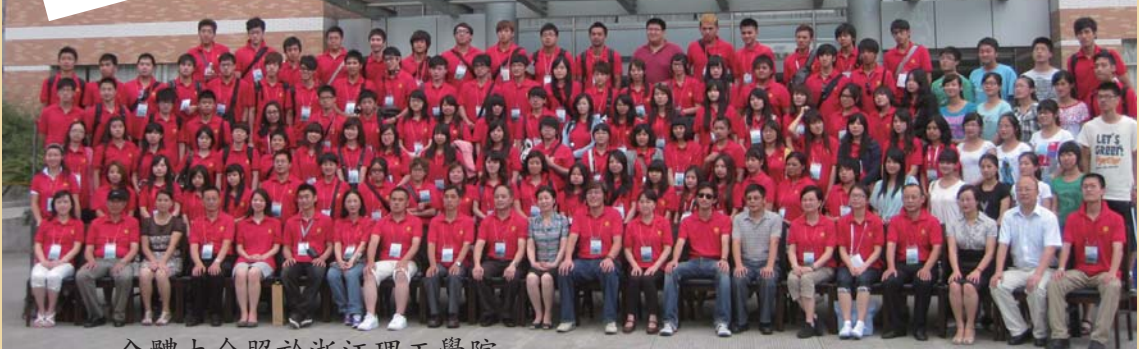
全體大合照於浙江理工學院