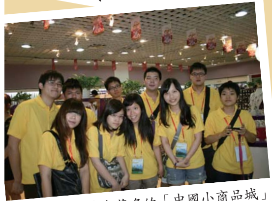
參觀義烏著名的「中國小商品城」