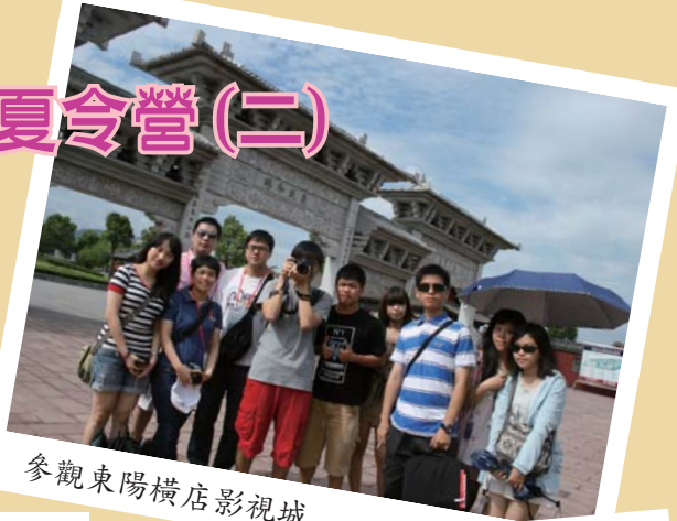
參觀東陽橫店影視城