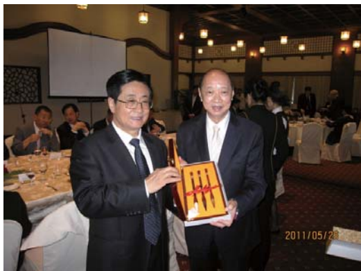
與趙書記互贈禮品

浙江省委書記趙洪祝先生率領「富春合璧·兩岸同緣」浙江文化寶島行」代表團抵台，本會為表達歡迎之忱，特由本會理事長葉潛昭先生、名譽理事長斯孝坤先生及陳和貴常務理事、嚴長庚理事代表前往台北圓山飯店迎接趙書記等一行人。