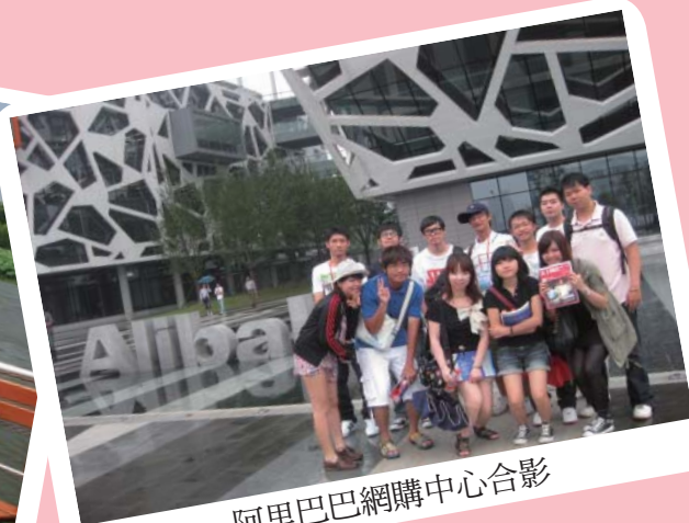
阿里巴巴網購中心合影