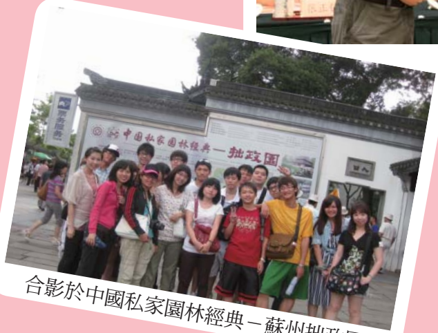
合影於中國私家園林經典—蘇州拙政園