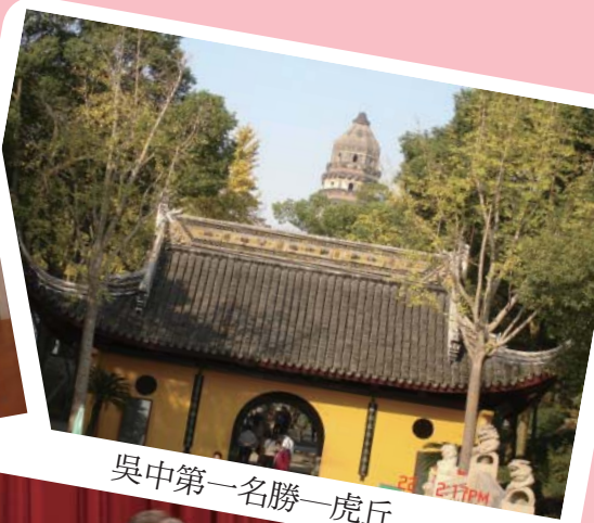
吳中第一名勝—虎丘