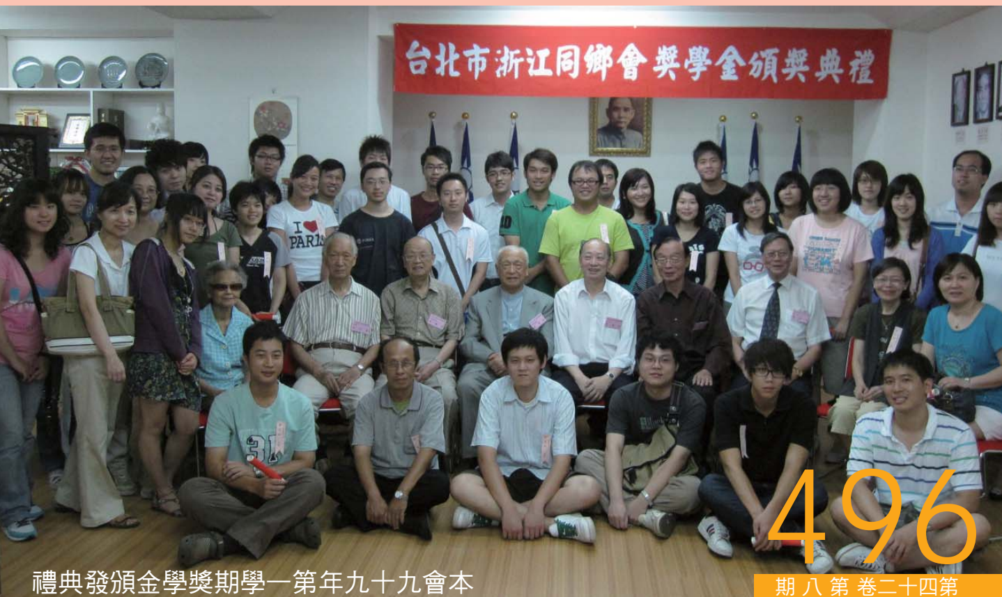
禮典發頒金學獎期學一第年九十九會本