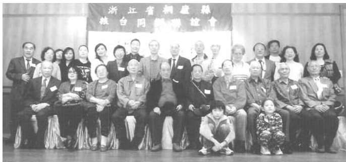
浙江省桐廬縣旅台同鄉會九十九年新春聯誼會