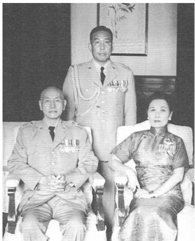
中興橋畔 鑄煉中興

〈中興演習〉的總指揮中樞，設於台北市通往台北縣的〈中興橋〉畔之西門國民小學內，也算是那時候台灣軍民同胞共同的心願——中興、中興……莫讓大陸同胞「西」望王師又一年；勿教故鄉親人倚「門」翹望白了頭！