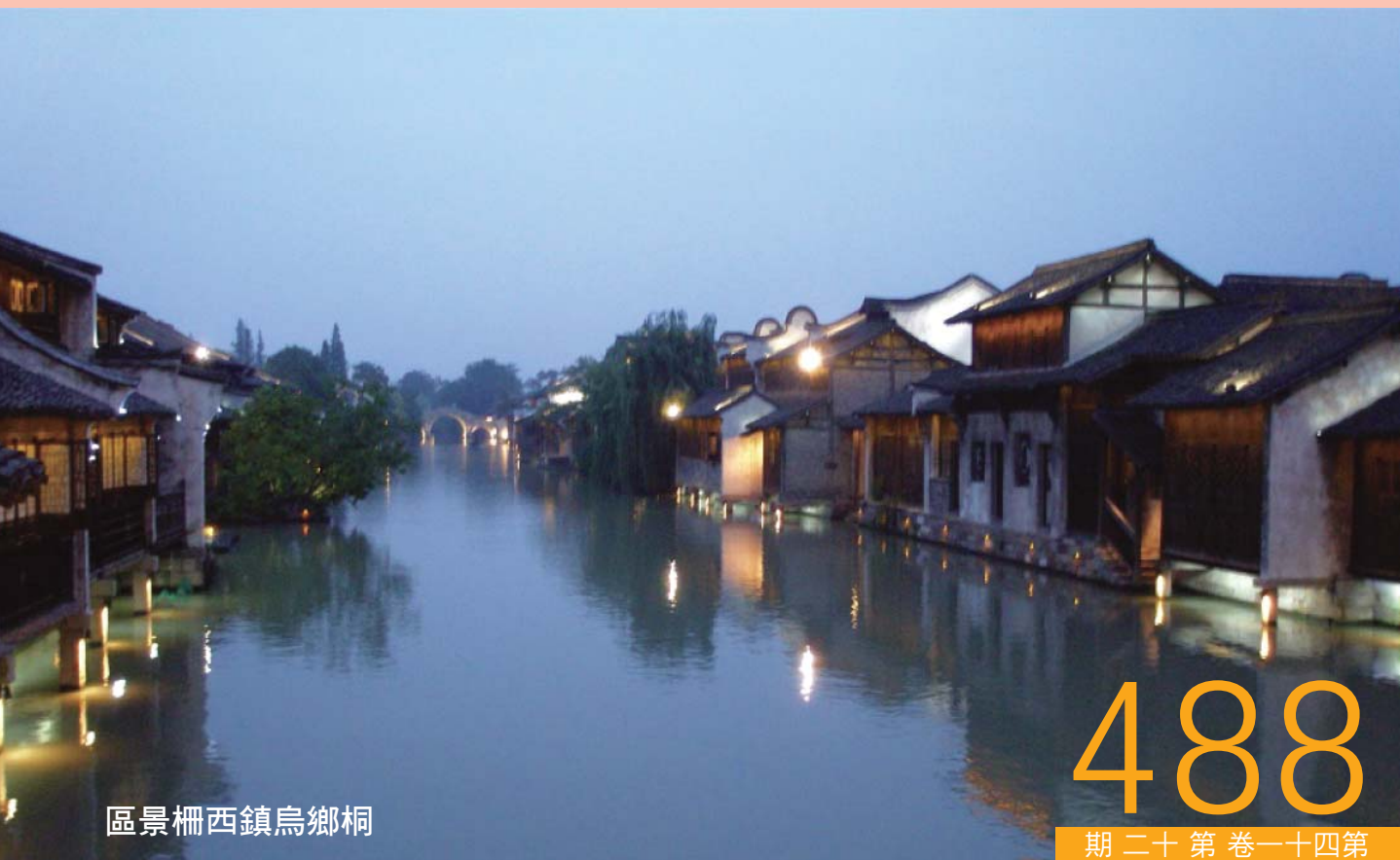
區景柵西鎮烏鄉桐