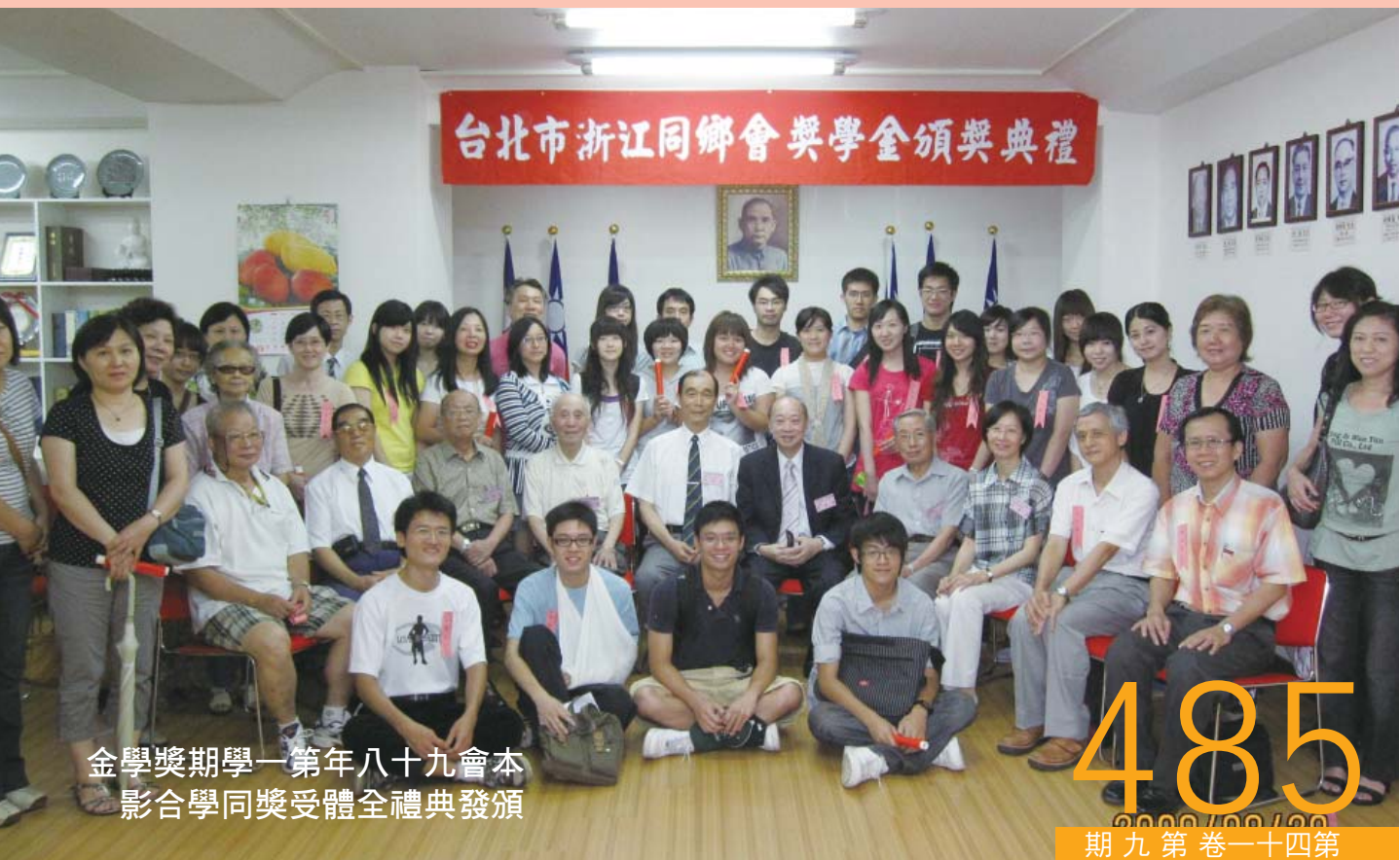
金學獎期學一第年八十九會本 影合學同獎受體全禮典發頒