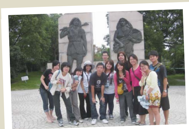
餘姚河姆渡博物館