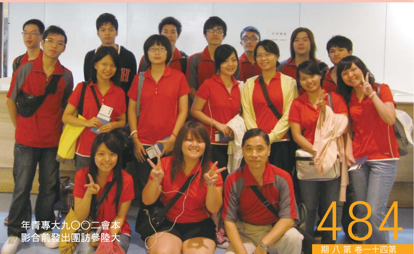
年青專大九〇〇二會本 影合前發出團訪參陸大