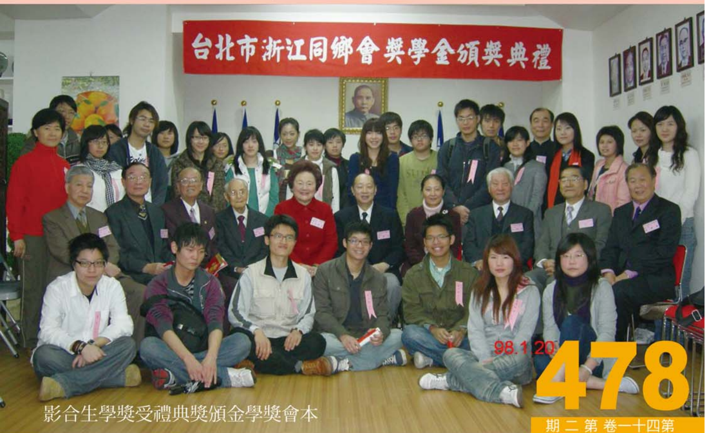
影合生學獎受禮典獎頒金學獎會本