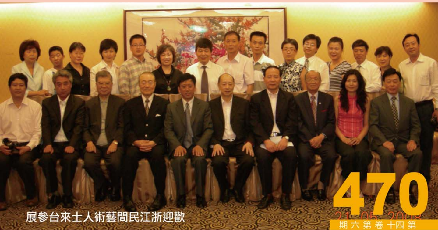
展參台來士人術藝間民江浙迎歡