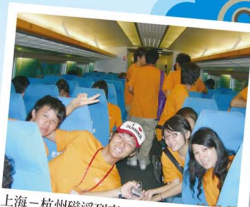
上海—杭州磁浮列車