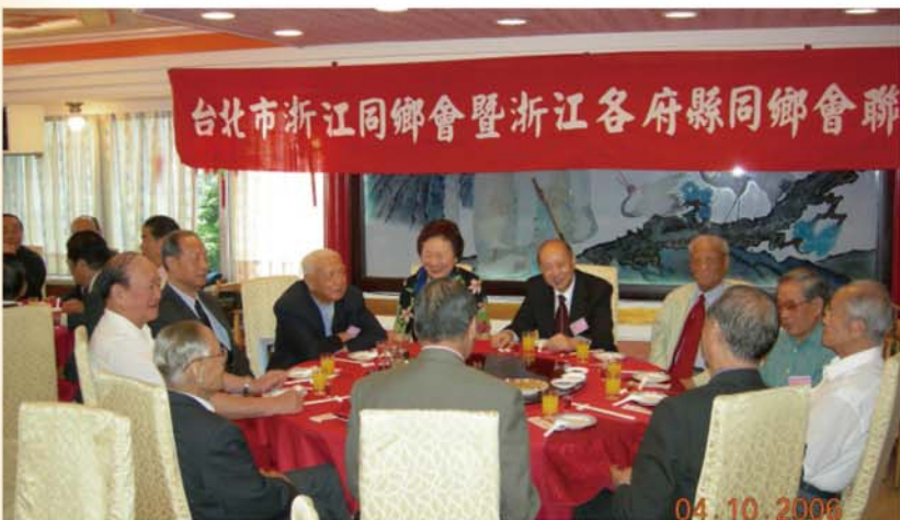
本會暨浙江各府縣同鄉會聯誼會餐

行政院新聞局出版事業登記證局版臺誌字第〇三九一號 中華郵政台北臺字第〇六〇二號 執照登記為雜誌類交寄